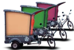
Alquiler y Venta